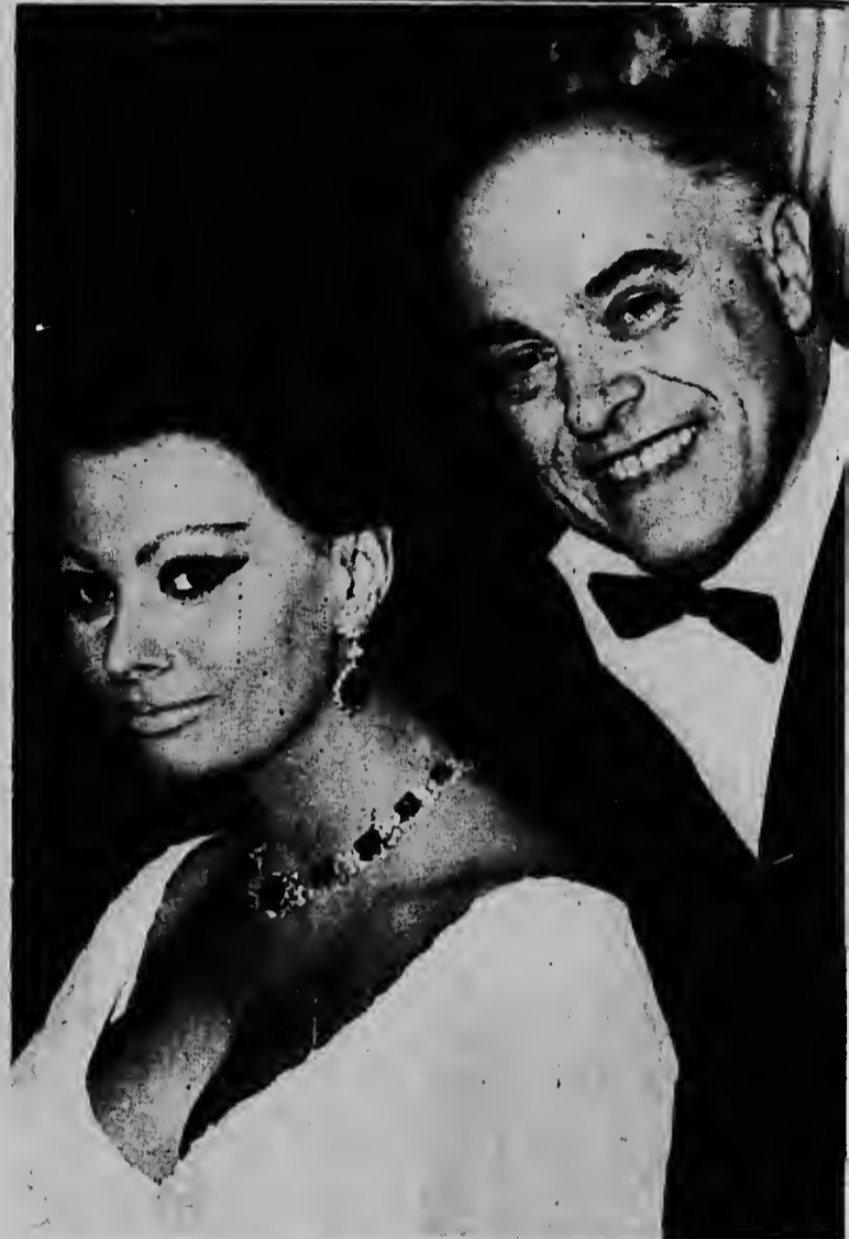
NEW YORK -- Radiophoto UPI -- Mirando contento prome di sali pa atende e premiere di "Doktor Zhivago", e actriz italiana Sophia Loren y e productor Carlo Ponti ta sosoga na nan hotel. Nan a ricibi bon noticia, ora nan a ser informa cu Ponti su casa a hanja divorcio frances. Esaki ta haci cu nan dos awor por casa cu otro.

Ferrera ta figura na e segundo lugar di e clasificacion di Asosacion Mundial di Boxeo.